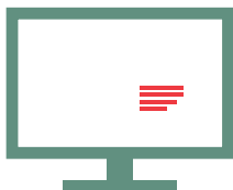
Article sponsorisé ou Publi-communicés